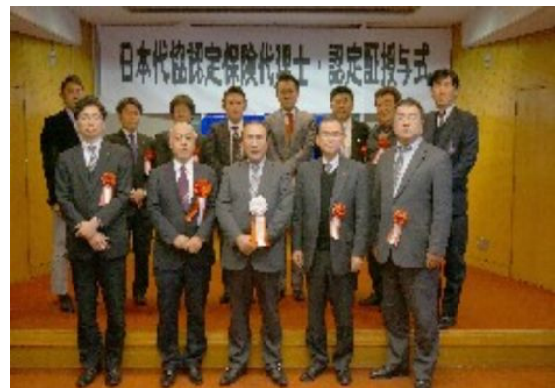
十名の卒業生を囲んで記念写真

二月一九日 成田市大栄公民館にて 北総支部・銚子支部・東葛支部主催 富士火災海上保険(株)共催 オープンセミナー開催