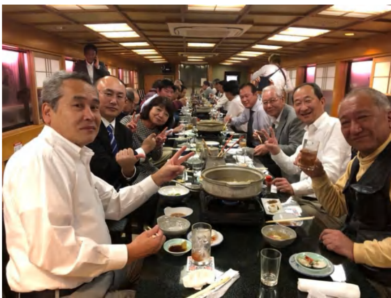
明日の活力得たと見た！皆様、素敵な笑顔有難うございました。