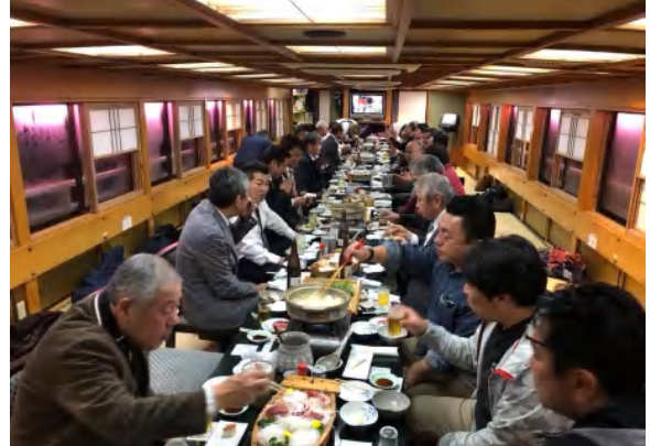
会員の皆様、食べてますか、飲んでますか、楽しんでますかー！！