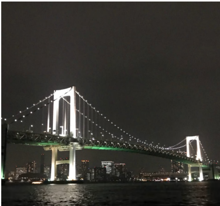
ベイブリッジ綺麗ですね。葛西臨海公園も夜景で見ると海外みたいに見えますね。