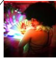
歌妖怪やじろべえ

URL http://www.culture.chiba.bunkaplaza.com