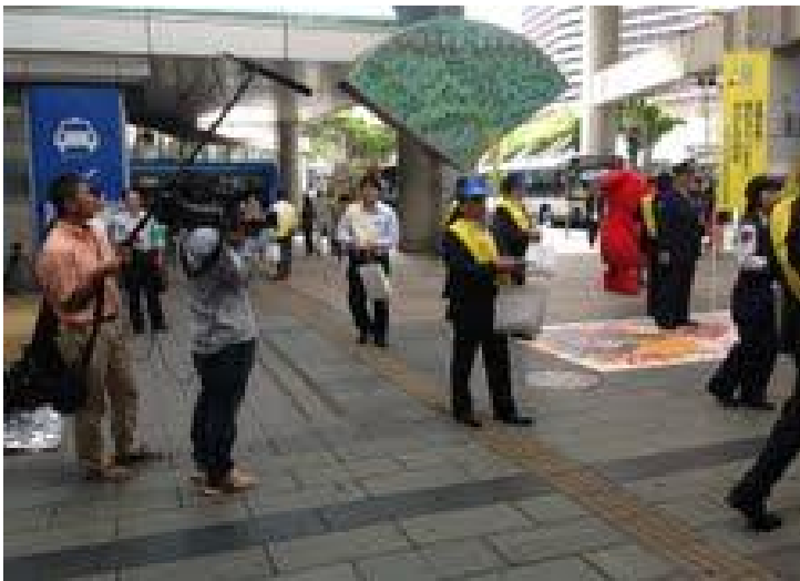
JR千葉駅頭にて、道行く市民に盗難防止を訴えるチラシを配る活動隊！！