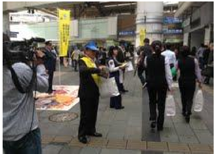
当日はキャンペーン活動をNHKも取材に来てました。皆さーん、自分の大切な自動車&バイク&自転車等々盗難に合わないようしっかり見張りましょう！！